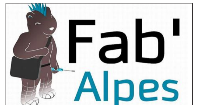
La campagne de financement pour le Fab'Alpes se passe sur internet.

La campagne de financement se passe aussi sur internet